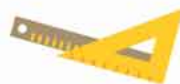
DIBUJO ARQUITECTÓNICO Y CONSTRUCCIÓN