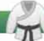
Tae Kwon Do. y karate