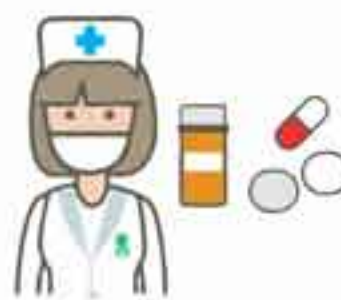
AUX. DE ENFERMERÍA