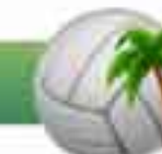
Voleibol de playa.