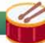
Banda de guerra