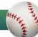
Beisbol y Softbol.